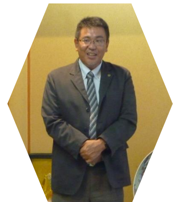
ラペルボタン引継ぎ