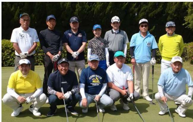
会長杯ゴルフコンペ