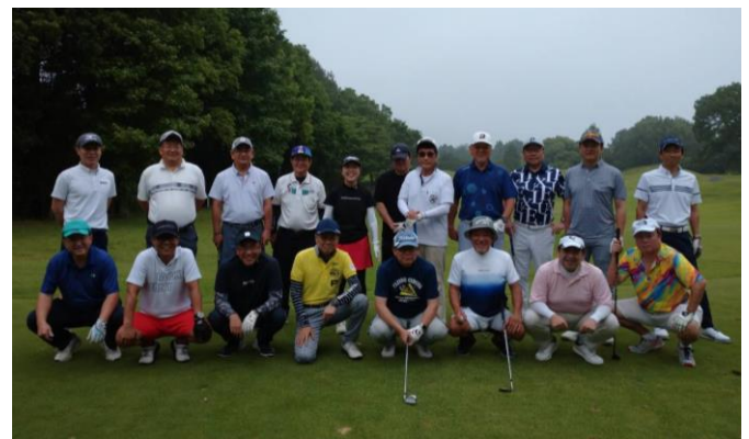
川之江LCとの合同親睦ゴルフ大会