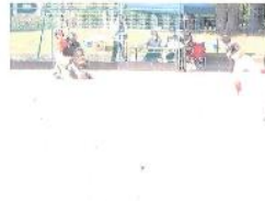
<ミニバスケットボール男子>