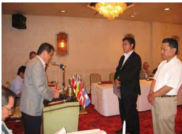
篠原会長歓迎のことば