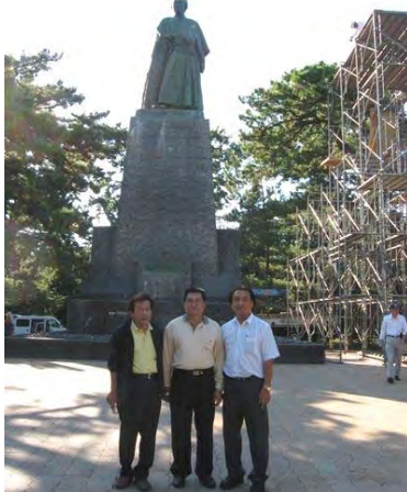
高知観光 坂本龍馬像前