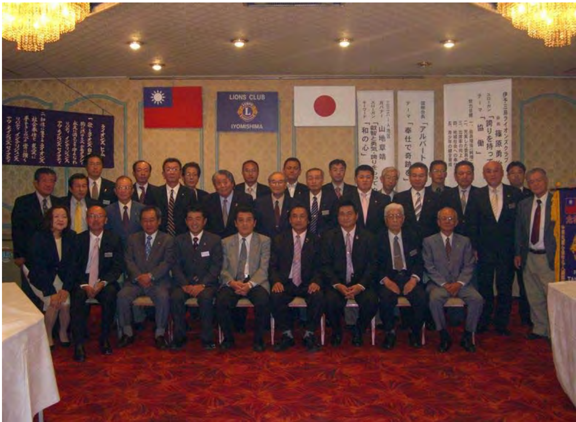
10月第2例会 名人獅子会訪問メンバーと記念撮影