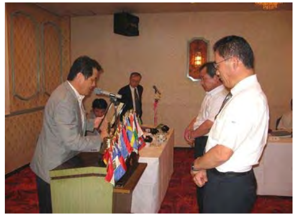
前年度会長・幹事へ感謝状贈呈