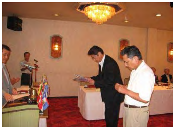
新会員キット贈呈