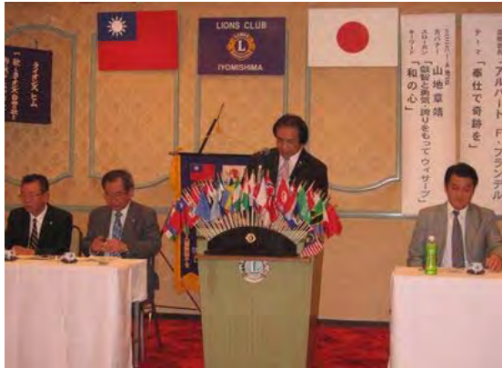
名人獅子会25周年の案内をする陳会長