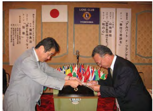
スポーツ少年団助成金贈呈 10 / 2