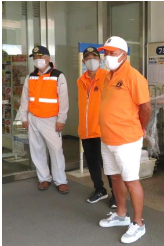
献血ご協力願います！