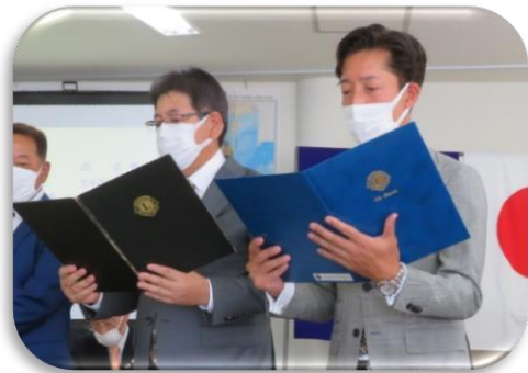
新会員2名一緒に、ライオンズの誓