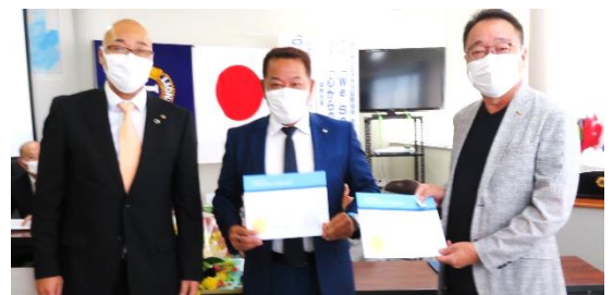
スポンサーシップ