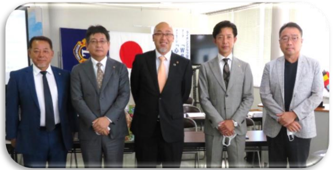
スポンサーと一緒に