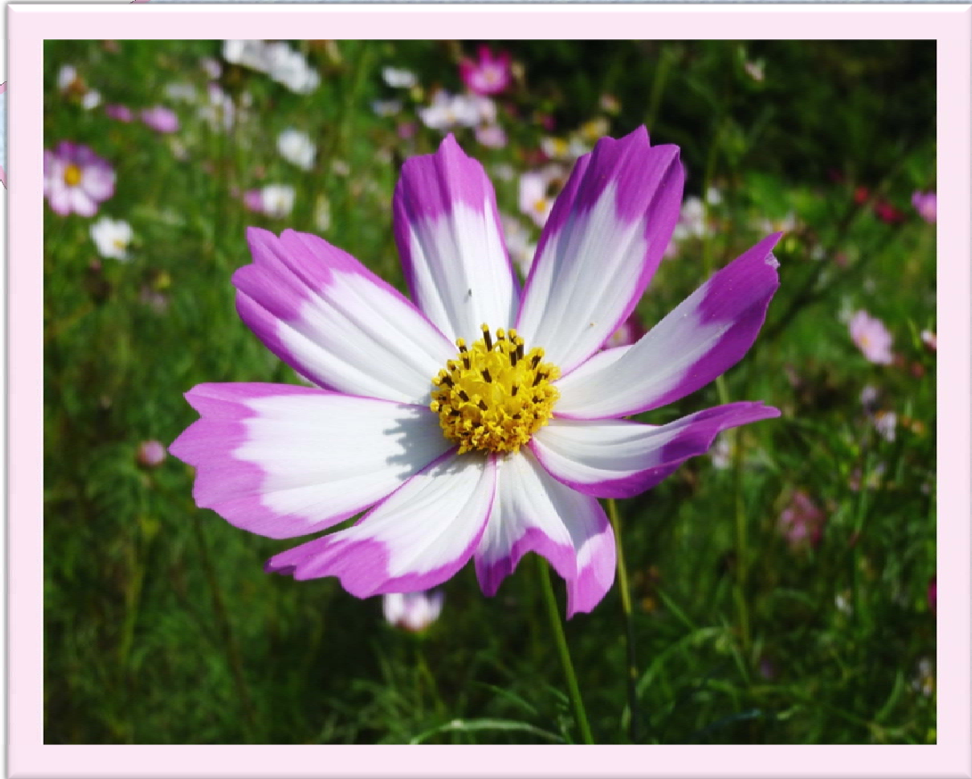
新居浜市日咲く コスモス