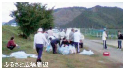
ふるさと広場周辺