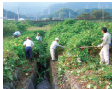
北野自由広場周辺

年に1度くらい行っている北野自由広場でしたが、約45名の参加人数でした。皆さん草狩り機とゴミ拾いに分かれて行いました。ゴミは以外に少なく、でも草だけは大きく伸びており、草狩り機を扱っておられた皆さん大変そうでしたが、何とか伐採できました。